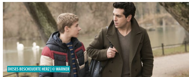
DIESES BESCHUEuerte HERZ