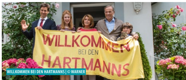
WILLKOMMEN BEI DEN HARTMANNS